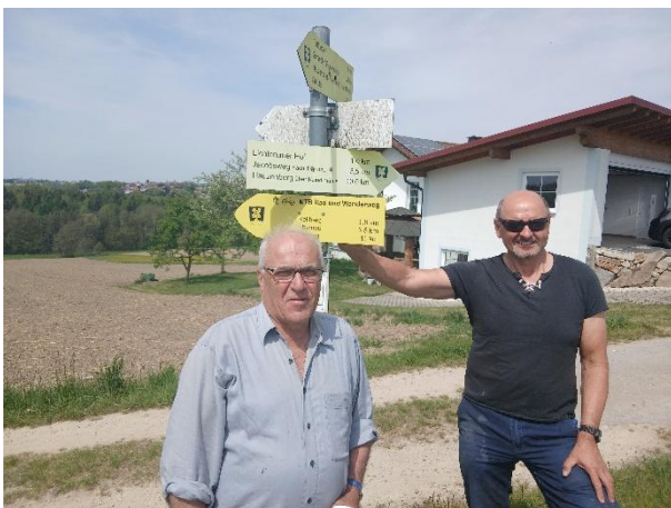
MTB Rad- und Wanderweg