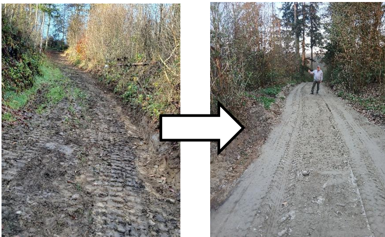
Teufelspflaster vorher und nachher