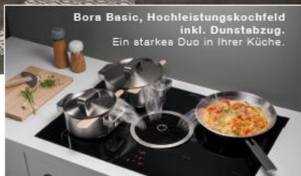
Bora Basic, Hochleistungskochfeld inkl. Dunstabzug. Ein starkes Duo in Ihrer Küche.